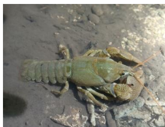
Ecrevisse à pieds blancs