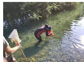
Prospection mollusques

Les poissons parmi lesquels la Truite fario indicatrice de bonne qualité des rivières, le Chabot repas de choix de la cigogne noire et la Lamproie de planer espèce protégée. L'élaboration d'un Plan d'action en faveur des poissons démarre en 2026 avec les acteurs concernés. L'objectif est