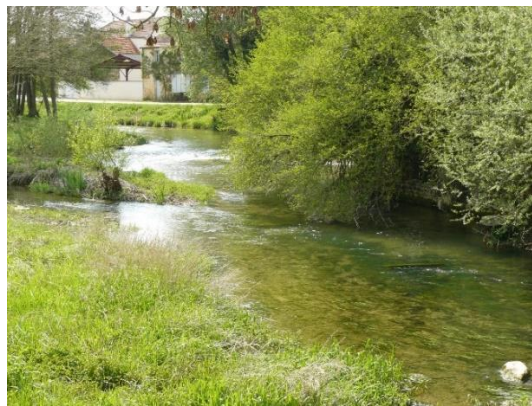
L'Ource à Brion