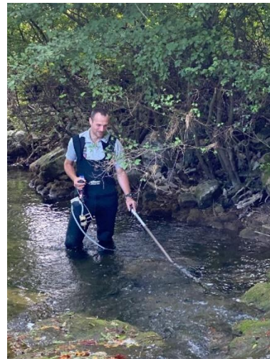
Prélèvement ADNe méthode Spygen

En complément des prospections visuelles, le Parc national de forêts expérimente une méthode non invasive basée sur la détection de l'ADN environnemental (ADNe) . Celui-ci est laissé à l'état de traces dans l'eau par les espèces présentes. Cette analyse permet d'évaluer la présence ou l'absence des espèces étudiées. C'est une méthode particulièrement utile pour détecter la présence d'espèces difficiles à observer ou dans des secteurs difficiles d'accès. Elle permet en outre la détection de pathogènes (peste de l'écrevisse). Cette technique a été mise en œuvre en 2024 et 2025 sur le territoire du Parc national à des fins de détection de l'Ecrevisse à pieds blancs et de la peste de l'écrevisse.